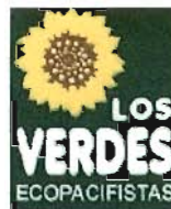
Los Verdes Ecopacifistas de Centro Moderado ( Centro Moderado)